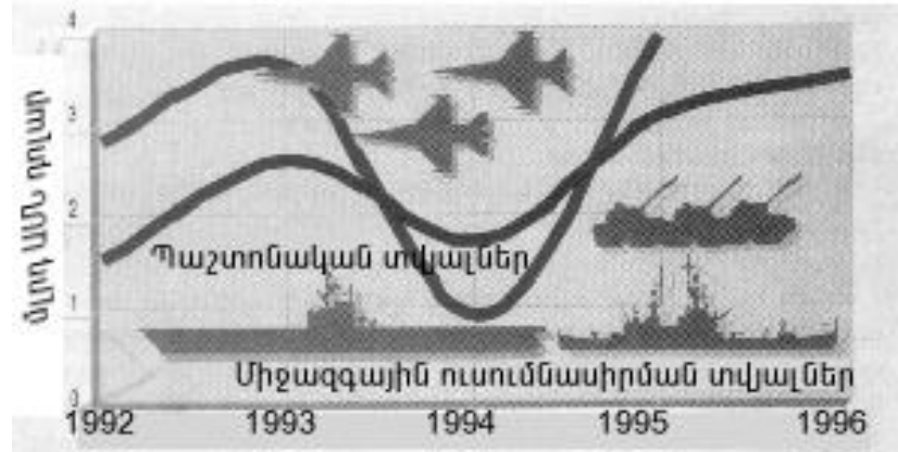
Պ ն յ չ Ի 2

Սակայն այս փոփոխությունները «Գեներալ-Մայոր»-ի շնորհիվ չեն փոխարկվում: Զինվորական կառուցվածքի մեծացումը և զինավորումների կազմակերպության փոփոխությունները ընդհանուր առմամբ չեն փոխարկվում: